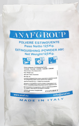
12,5 KG SACK ABC PULVER