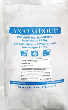
25 KG SACK ABC PULVER