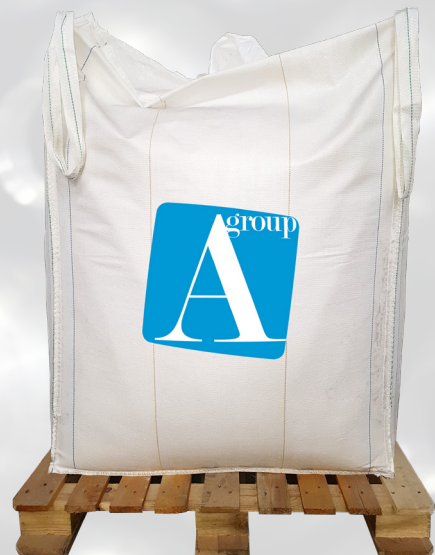
1.000 KG SACK ABC PULVER